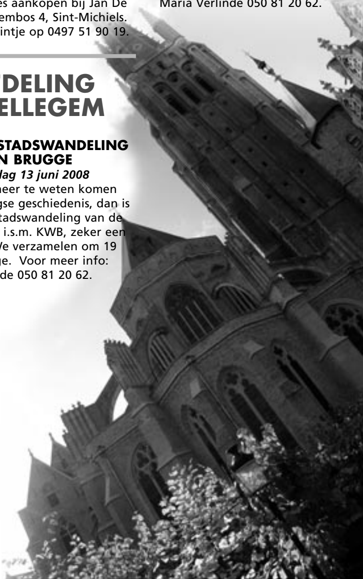
toernamen Brugge

Inschrijven ten laatste tegen 12 april 2008 bij Conny Vermoote 050 38 31 34 (na 19 uur) of info@gezinsbond-varsenare.be . Bijdrage voor de 10 lessen voor leden Gezinsbond is € 10,00 + € 6,00 verzekering. Niet-leden betalen € 25,00